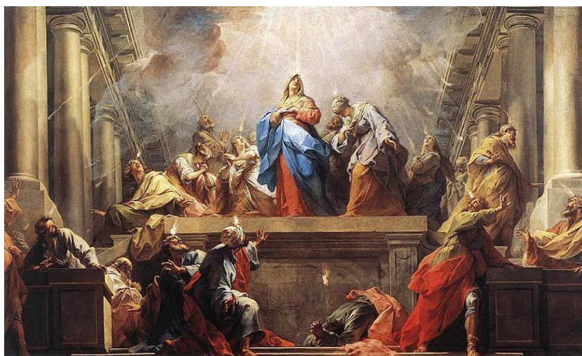
Jean II Restout, Pentecost, olej na plátne, 1732