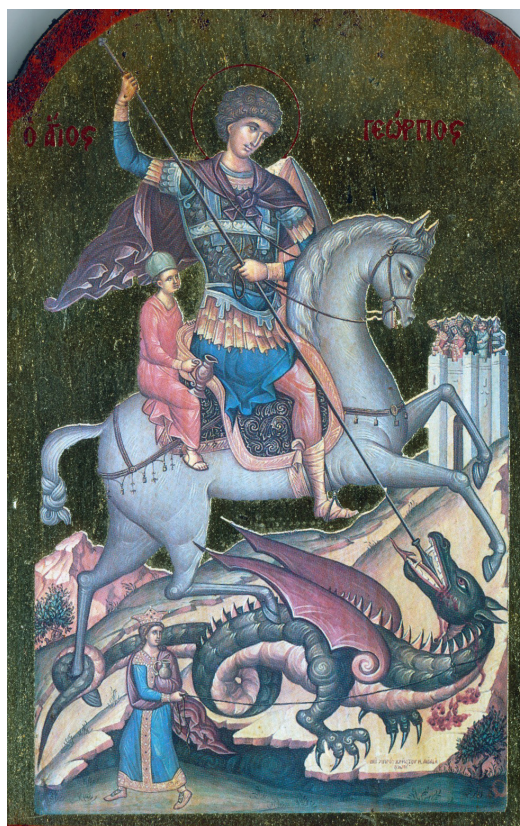
GEORG, ikona darovaná farskému úradu

V súvislosti zo vznikom farského časopisu som sa aj ja rozhodol napísať článok. Počas svojho života som sa niekoľko krát zúčastnil na rôznych pútiach. Jedna z mojich pútnických ciest viedla po stopách sv. Pavla v Grécku. Pri obdivovaní nádherných miest som objavil maličký obchod zo suvenírmí. Mali v ňom rôzne veci a medzi nimi aj drevený obrázok, ikonu, na ktorej bol vyobrazený sv. Juraj. V gréckej reči Georgos, podobne ako názov farského časopisu. Ikonu som kúpil a podaroval farnosti a redakčnej rade. Urobil som to preto, aby mali pri pohľade na sv. Juraja, dosť odvahy a rozvahy pri tvorbe farského časopisu.